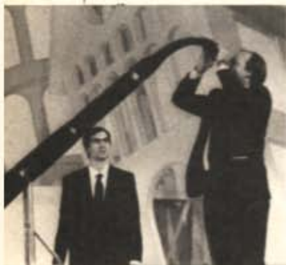
Sopra, una gigantesca pipa presentata durante la trasmissione televisiva "Roba da matti"; in alto, alcuni attrezzi tradizionali del "fai da te"; nella pagina accanto, un disegno di Jezek

L'inventore, di solito, è un uomo dalla mente geniale, pirotecnica, che corre veloce, a volte più veloce del tempo, alla ricerca di oggetti, attrezzi, strumenti, che possano rivoluzionare usi e costumi di generazioni intere. Marcia continuamente su un filo sospeso tra l'irrealizzabile e il possibile, ed è il futuro a tenderlo, quasi come se volesse mettere alla prova i nervi, la resistenza, la pazienza di quest'individuo così atipico. Mettendo da parte l'immagine poetica che fantasia e realtà hanno costruito nei secoli intorno alla figura dell'inventore, c'è da dire che sia la piccola che la grande industria, fondano le loro basi su una continua ricerca portata avanti quotidianamente da tecnici altamente preparati, da esperti del settore che volgono i loro sforzi alla scoperta di un nuovo "passo inventivo". Perfezionare la produzione, diminuire i tempi di lavoro, progredire: questi gli obiettivi principali degli "inventori" del nostro tempo. Forse più che inventori bisognerebbe chiamarli: "ricercatori di innovazioni produttive", i tempi cambiano e occorre adeguarsi!